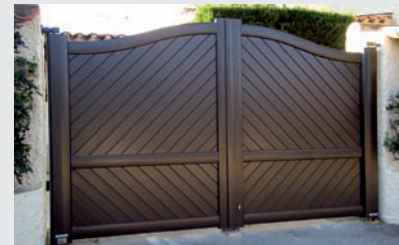
Détail du montant latéral avec l'automatisme intégré Fusion