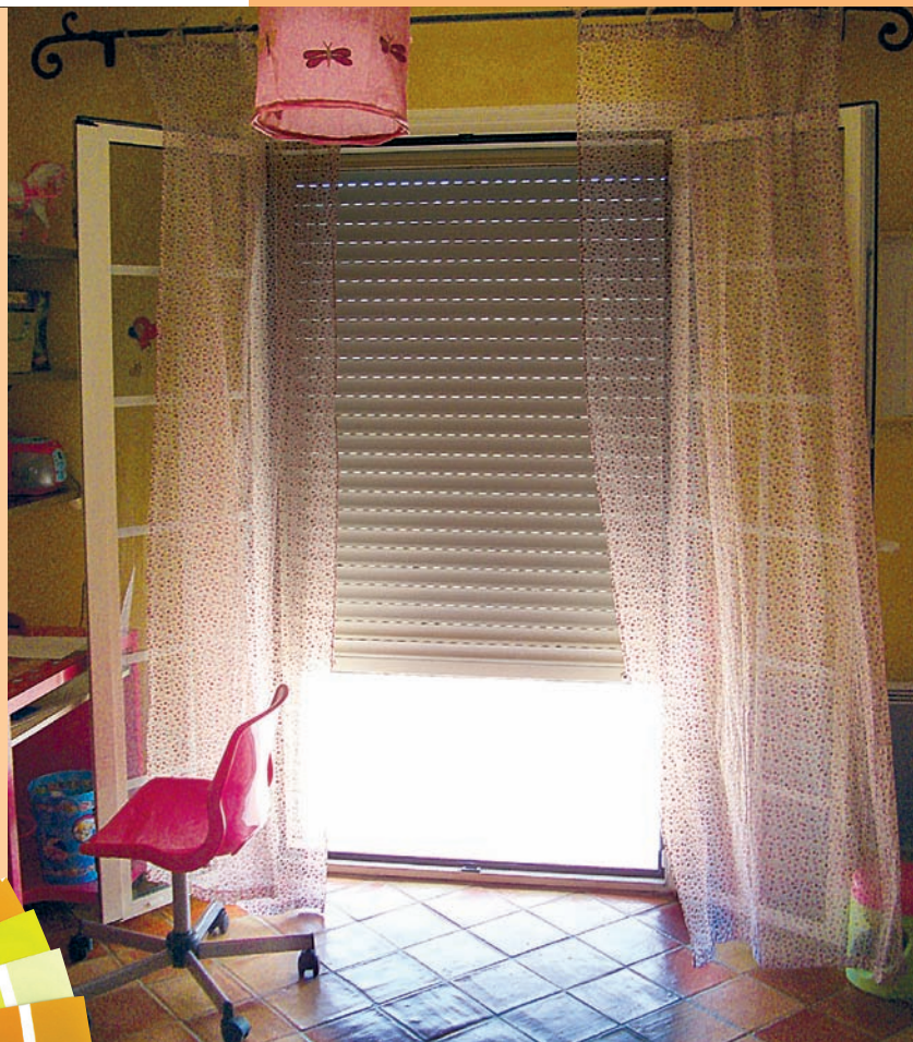
Pose en tableau, enroulement intérieur dans coffre-tunnel pour un volet roulant traditionnel